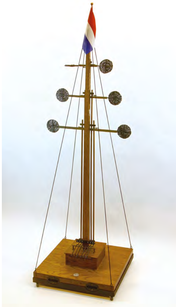
Figuur 4 | Model van de Lipkens-telegraaf.

De stations van Lipkens konden 63 ( 2^6-1 ) verschillende tekens instellen. Deze stonden voor 10 cijfers, 26 letters, en 27 zogenaamde dienstcodes. Voordat een bericht verzonden werd, werd eerst een 'attentie' teken geplaatst, waarbij alleen de bovenste vier schijven zichtbaar waren. Als alle schijven zichtbaar waren, betekende dit dat het voorgaande sein verkeerd was en dat er een nieuw sein kwam. Voor al dat soort instructies waren 27 seinen gereserveerd.