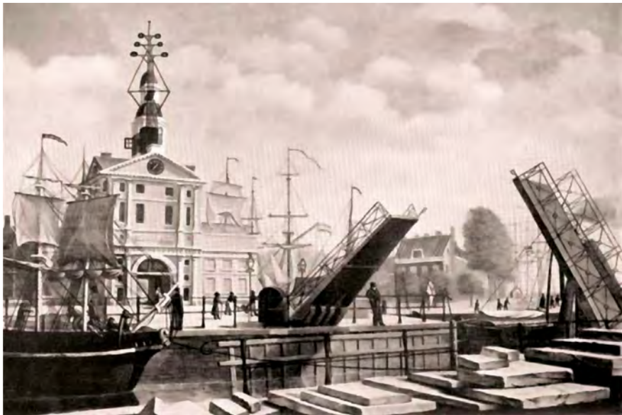
Figuur 2 | De optische telegraaf van Lipkens op de Wittepoort, Rotterdam 1835.

Het lukte Lipkens de verbinding Den Haag – Breda in 11 dagen operationeel te maken. Het werd twee dagen vóór de deadline opgeleverd, maar twee dagen te laat om nog van belang te zijn voor de 10-daagse veldtocht. De lijn werd later verlengd tot Den Bosch. De lijn kwam onder beheer van de topografische dienst van het ministerie van Oorlog.