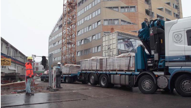
Voorbeeld van een aflevermoment op een bouwplaats