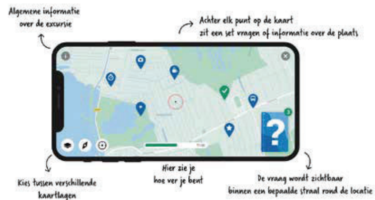
Figuur 3: De Peek-app.