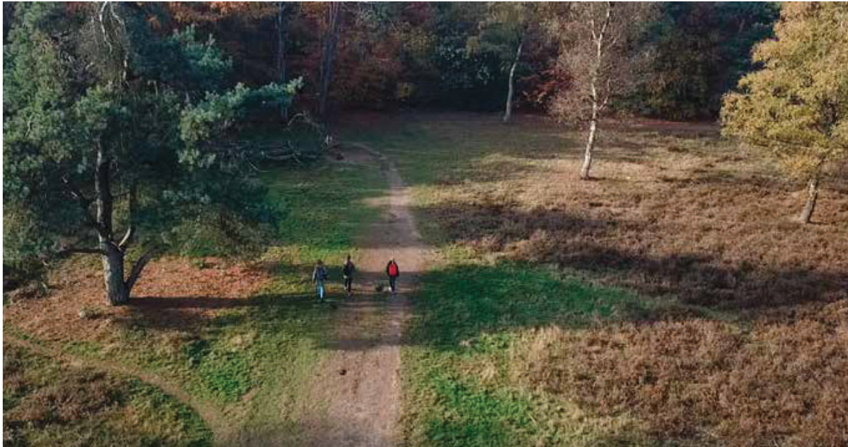
Zomer 2020: corona-proof het veld in met hulp van de PEEK-app, ontwikkeld door Wageningen Universiteit.