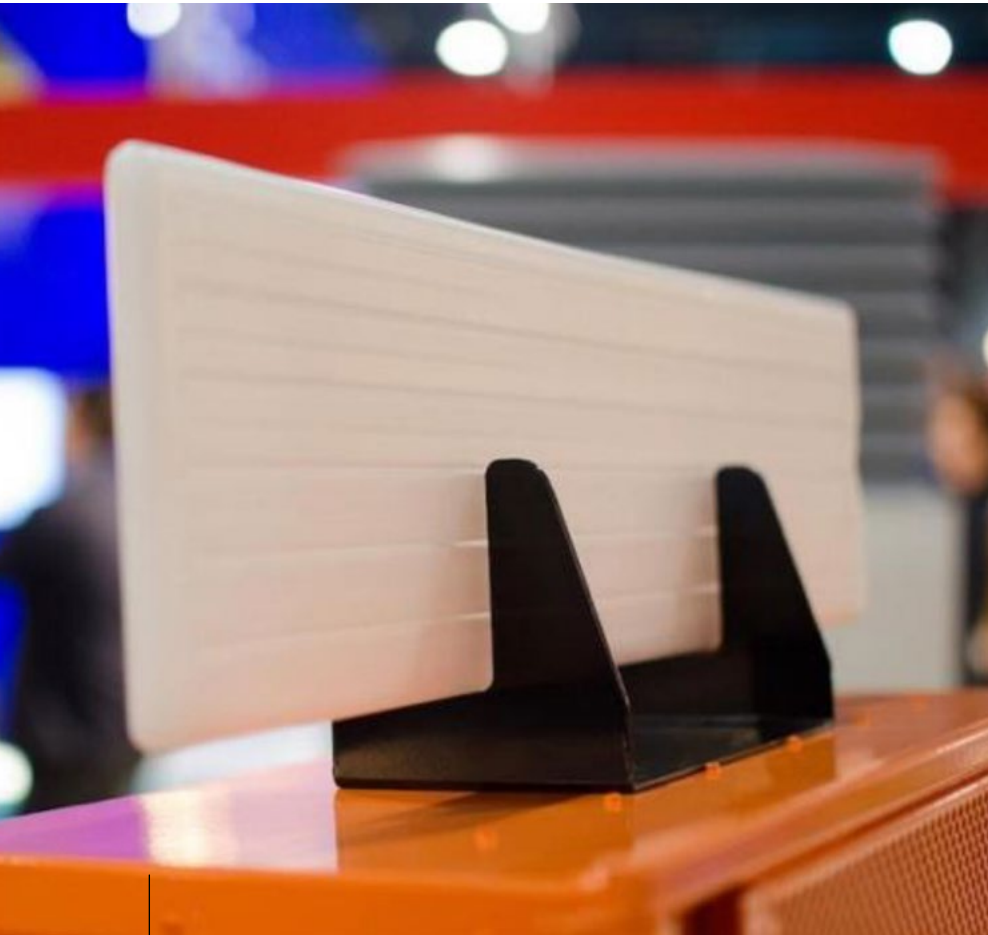
Figuur 3: CSP Panels faseovergangsmateriaal PCM Technology.

is een eerste 'Lift as a Service' concept geleverd in Circl, het paviljoen van ABN Amro op de Zuidas in Amsterdam. Mitsubishi heeft hier haar M-Use-concept gelanceerd. Dit is een circulair model voor liften, waarbij wordt afgerekend op gebruik in plaats van een traditionele aanschaf en onderhoudsabonnement. Dit 'product as a service'-model voorkomt hoge investeringskosten voor de klant én hergebruik en recycling staan daarbij