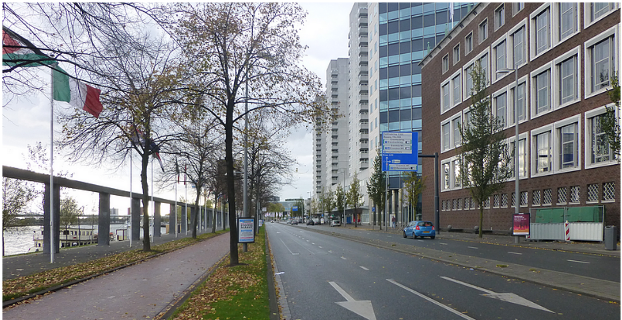
Voorbeeld van het Nieuwe Bouwen: De Boompjes in Rotterdam