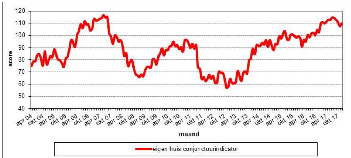
Figuur 2.3 De gemiddelde scores op de Eigen Huis Conjunctuurindicator, op maandbasis in de periode april 2004 – december 2017, in Nederland