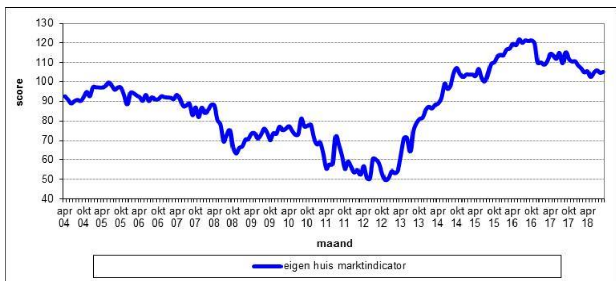
Figuur 2.1 De gemiddelde scores op de Eigen Huis Marktindicator, op maandbasis in de periode april 2004 – september 2018, in Nederland