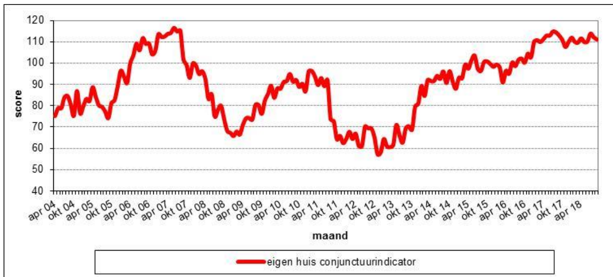
Figuur 2.3 De gemiddelde scores op de Eigen Huis Conjunctuurindicator, op maandbasis in de periode april 2004 – september 2018, in Nederland