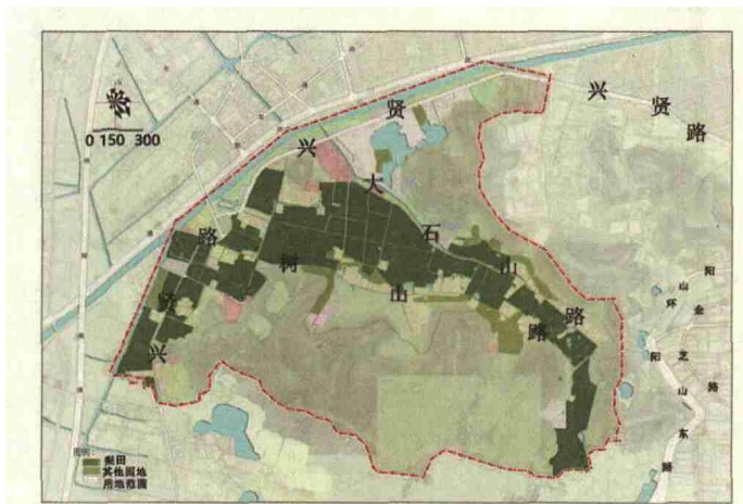
图4 树山村第一产业分布图

研究分析虎巢里资源分布情况，重新规整资源、划分空间结构。引导梨园产业向第三产业多维度衍生发展，保证农产品的产量、质量同时带动旅游业、服务业发展。借助特色田园乡村模式来规划虎巢里农业资源，紧密联系梨田景观与周围聚落及其负形景观空间之间的整体规划和关联度。（图5）虎巢里内部主要交通路线的相邻空间类型较简单，两边散落着大小不一、质量不均的民房。依据虎巢里现状调研，寻找空间类型发展的可能性并实行“一轴两片多点”的发展策略，针对民宿片区、休闲片区、生态园地建构综合性景观结构。设计的目的