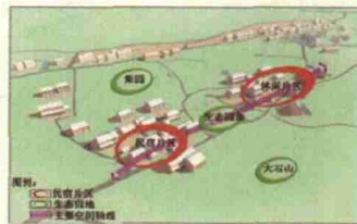
图6 虎巢里空间构成分布图