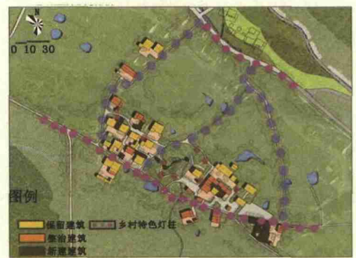
图7 虎巢里主要景观道路分析图