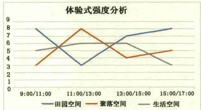
表 2-3 空间体验强度分析和季节性强度分析表

第一产业：主要指树山村原生态丰富的梨田、茶园、杨梅林等，并通过引进先进的农业科技成果来提升农产品加工业。当地乡民打造的“四月杨梅、六月梨”具有季节性特色的景观也进一步起到提升农业价值的作用，