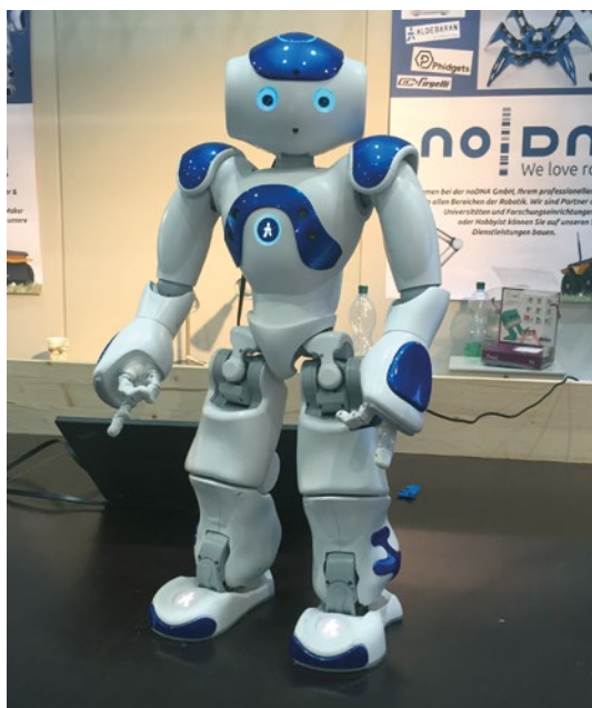
Figuur 4 De NAO-robot met zijn vriendelijke uiterlijk, is speciaal geprogrammeerd om kinderen af te leiden tijdens medische en tandheelkundige behandelingen.

In een voorgesteld systeem is het resultaat afhankelijk van een aantal factoren, onder andere de resolutie van de preoperatieve scan, de nauwkeurigheid van de registratieprocedure en ook die van de gebruikte navigatieapparatuur. Uit de cijfers komt naar voren dat het aanwijzen van de markers in de mandibula met de navigatiearm (door menselijke hand) verantwoordelijk is voor het grootste deel van de afwijking. De auteurs stellen een aantal verbeteringen voor op deze eerste versie, waaronder een aangepast vorm van de markers zodat de menselijke hand preciezer wordt. Daarbij verwachten zij een gemiddelde afwijking van minder dan 1 mm te kunnen bewerkstelligen.