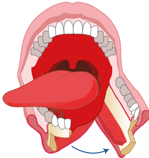
Figuur 1 Schematische weergave van een lipsplijting en mandibulotomie.

In de behandeling van hoofd-halstumoren zijn drie hoofdcategoryën te onderscheiden: chemotherapie, radiotherapie en open chirurgie. Chirurgische resectie is nog steeds de belangrijkste therapie voor de meeste typen tumoren. De resectie van tumoren in het hoofd-halsgebied vereist een ruime toegang tot de tumor, wat vaak grote en invaliderende operaties noodzakelijk maakt. Wanneer een tumor op een lastig te bereiken plek zoals de orofarynx/tongbasis zit, zijn een lipsplijting en mandibulotomie nodig zijn om toegang te verkrijgen tot het operatiegebied (figuur 1). Vanwege de omvang van een dergelijke ingreep wordt vaak uitgeweken naar (chemo)radiotherapie, met voor de tandarts bekende bijwerkingen (xerostomie, cariës, osteoradionecrose, mucositis). Alternatieve chirurgische mogelijkheden werden gezocht om de morbiditeit en de kwaliteit van leven na chirurgie te verbeteren.