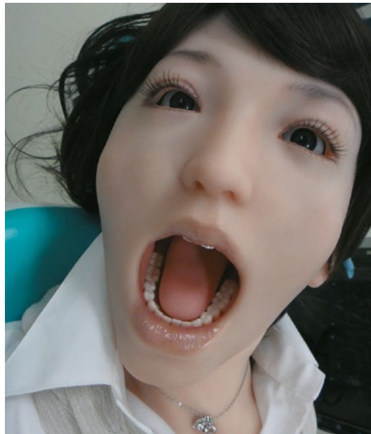
Figuur 3 Showa Hakana 2, een goed voorbeeld van een humanoïde robot.

Sinds enige tijd wordt er in de implantologie gebruikgemaakt van digitale planningssoftware. Na een conebeam-CT-scan van de patiënt wordt een digitaal plan opgesteld waarbij de ideale implantaatpositie kan worden bepaald. Er zijn hoofdzakelijk twee methoden om het virtuele plan naar de patiënt te vertalen: de fysieke boormal en 3D-navigatie. Hoewel beide technieken op zichzelf vrij nauwkeurig zijn, is voor het plaatsen van het implantaat nog steeds menselijk handelen noodzakelijk. Volgens een artikel van Sun et al. zit hierin onvermijdelijk ruimte voor fouten, waarbij de kundigheid van de behandelaar nog steeds een belangrijke rol speelt in het eindresultaat. 8 Door tussenkomst van de robot kan een virtueel plan direct naar de patiënt worden