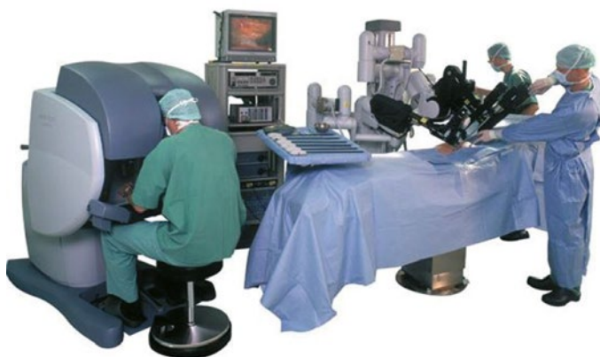
Figuur 2 Het Da Vinci Surgical System. De behandelaar bevindt zich enkele meters bij de patiënt vandaan.

Daarnaast is het niet mogelijk met de robot te boren en is er op dit moment geen 'haptische feedback' mogelijk, dat wil zeggen feedback van de robot naar de operateur over weerstand en krachten. Hiernaar wordt overigens wel onderzoek gedaan. 3 Vanwege het brede gebruik van de robot in de geneeskunde wordt er veel onderzoek gedaan om hem te verbeteren. Zo wordt er gewerkt aan een feedbacksysteem en ook aan de mogelijkheid om ermee te boren. Dit laatste zal de toepasbaarheid vergroten, zeker in de hoofd-halschirurgie en kaakchirurgie, maar mogelijk in de toekomst ook in de tandheelkunde.