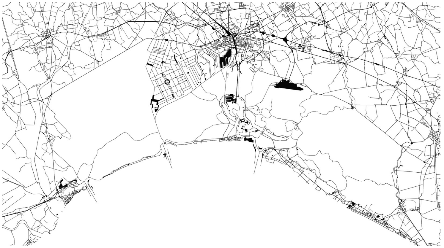
Fig.1 _Progresso. Sistema della viabilità della laguna veneta (elaborato di L. Luorio, 2020).

La mappa mette in connessione il sistema della mobilità attuale con le infrastrutture proposte nel piano Miozzi-Baldin del 1959.