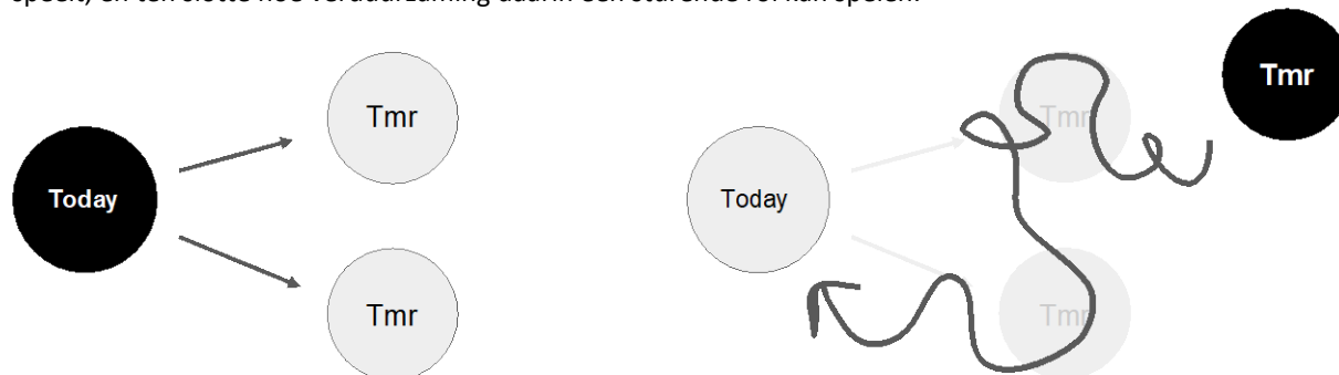
Figuur 2: Links, het forecasten waarbij de huidige situatie wordt geëxtrapoleerd naar de toekomst en er daarop beleidsmaatregelen worden genomen. Rechts, het backcasten waarbij vanuit een bepaalde toekomstige situatie terug wordt gereflecteerd naar vandaag en er daarop beleidsmaatregelen worden genomen (bron: Van den Berghe et al. (2023))

Niettemin, de ene sluit de andere niet uit. Idealiter moet geprobeerd worden de adequate operationalisering van duidelijke stappen en ingrepen te combineren met het rekening houden met een onzekere en impactvolle toekomst. Dit vraagt om een zeer goed begrip van wat er gebeurt op een bepaald bedrijventerrein, hoe deze in relatie staat met andere bedrijventerreinen in Nederland en verder, hoe die vandaag en in de veranderende context een rol speelt, en ten slotte hoe verduurzaming daarin een sturende rol kan spelen.