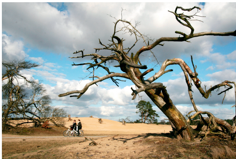
图1 梵高森林公园内骑行的参观者

在众多拥有城市荒野营造经验的国家中,荷兰具有一定代表性。荷兰是几乎由人工规划出来的国家,填海和堤坝工程造就了目前大部分国土 [24] 。在有限的国土面积和自然资源条件下,荷兰需要应对人口增长、高度城市化、基础设施压力和气候变化等挑战,因此在人居环境领域有诸多探索,包括创新及可持续性的城市空间规划、城市环境中自然式景观的营造等。我国对于荒野相关课题的探索正处于稳步发展阶段。虽然基本国情有所差别,但面临着高度城市化和景观空间高度人工控制等相似问题 [25] 。工作与生活压力也使公众对于城市中自然空间的需求增加,人类和自然的关系始终处于持续变化和潜在的不稳定中。因此,荷兰实践经验对于我国的城市荒野景观营造具有一定的借鉴性。