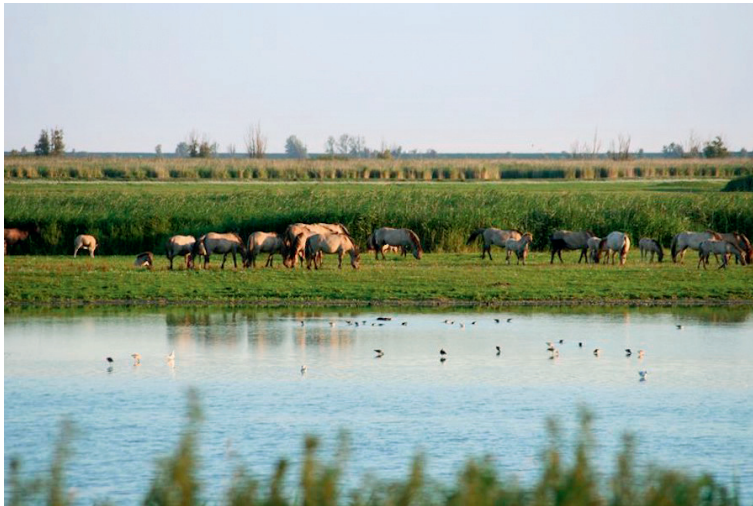
图2 欧斯特范德斯普拉森的马群

欧斯特范德斯普拉森(表1)是欧洲著名的湿地保护区,整体划分为沼泽和草原2个区域,其中沼泽部分占地约2/3。1965年之前,该区域只是一小部分海域,经填海造地后被指定用于工业开发。由于石油危机和随后的经济衰退,场地被荒废,自然得到了发展的机会,这里成为野生动物栖息的场所。人们决定在荒废后形成的沼泽地上撒芦苇种子,顺其自然生长,并通过营建人工设施和引入野生动物,经过长期自然演替,最