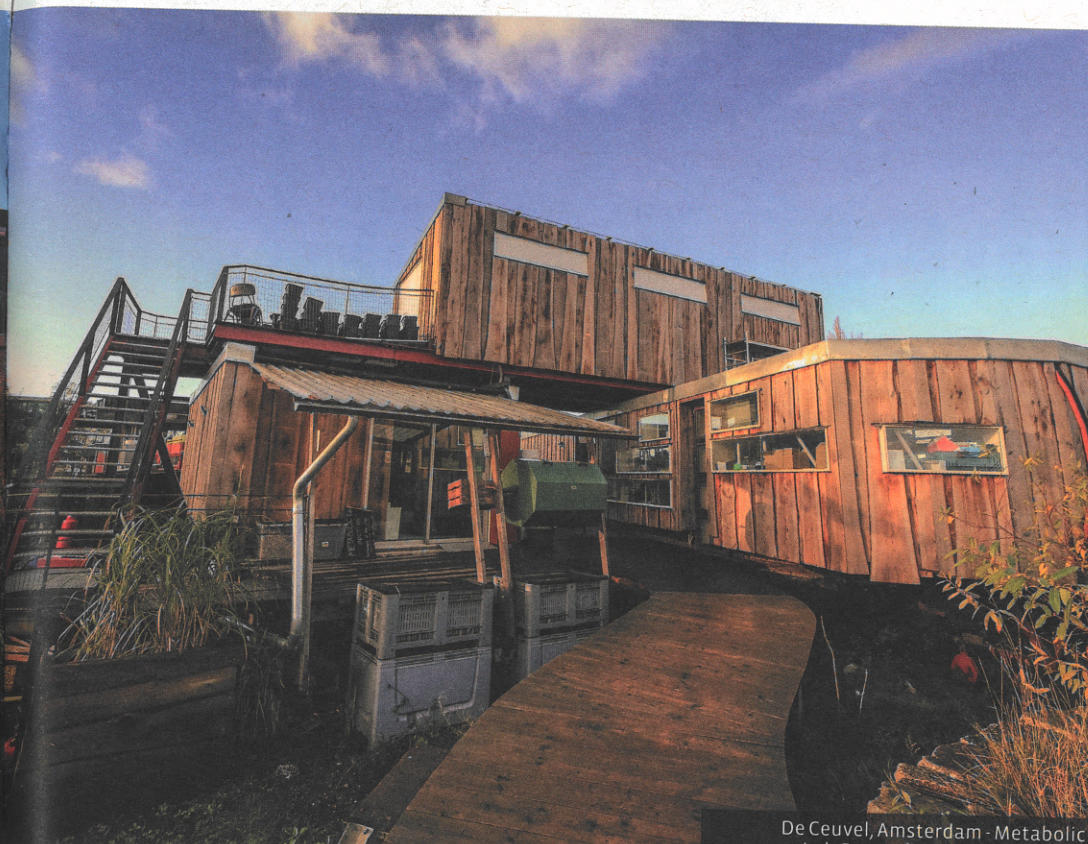
De Ceuveel, Amsterdam - Metabolic Lab Centre for Circular Thinking