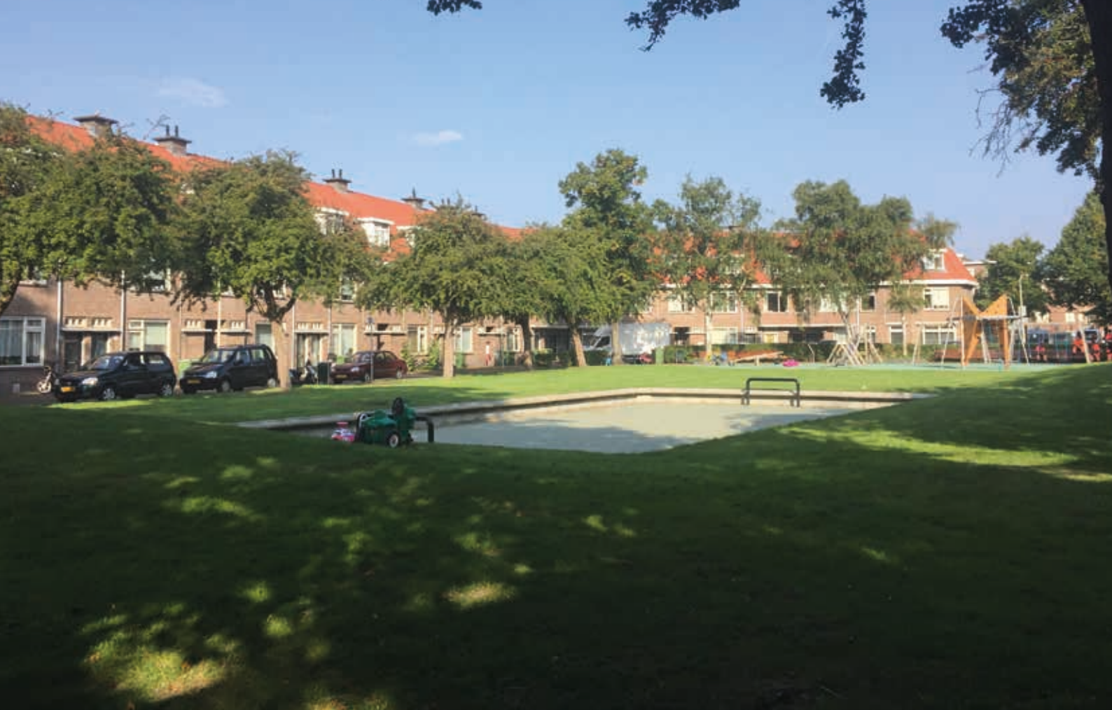
9b. Moerbeiplein (Vruchtenbuurt) in Den Haag in 2017. Veel stadsuitbreidingswijken die onder leiding van Bakker Schut werden gerealiseerd, zijn tegenwoordig geliefde woonwijken

Halverwege de jaren dertig was het einde van Bakker Schuts' loopbaan nog niet in zicht, maar de grote uitbreidingen waren achter de rug en er werden in vergelijking tot de voorgaande jaren nauwelijks meer gemeentelijke woningen gerealiseerd; tussen 1934 en 1940 bouwde de gemeente en woningbouwverenigingen slechts 2 procent van de in totaal bijna 7.000 woningen. 34 Berlage werd in 1934 opgevolgd door de architect en stedenbouwkundige W.M. Dudok (1884-1974). Deze kreeg de taak uitbreidingsplannen te maken voor Den Haag Zuid-West, maar voor de Tweede Wereldoorlog kwam er weinig van de plannen terecht. Bakker Schut begon ondertussen langzaam afscheid te nemen van de dienst; in 1939 publiceerde hij een gedenkboek over de volkshuisvesting in Den Haag, waarin hij in 240 pagina's terugblik op de betekenis van de overheidsbemoeienis met de volkshuisvesting tussen 1914 en 1939. 35