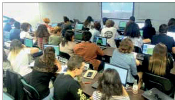
Aan de studie in Lissabon.

Na ruim twee jaar intensief samenwerken met de universiteiten van Glasgow, Florence en Lissabon is begin 2020 het Erasmus+ Geonatura-project afgesloten. Binnen het project is een openonderwijsplatform ontwikkeld voor sociale en milieutoepassingen van de geomatica. In totaal hebben 160 studenten, waarvan 40 van de TU Delft, deelgenomen aan het ‘blended learning’-onderwijsprogramma: één week contactonderwijs gevolgd door twee maanden afstandsonderwijs. Het afstandsonderwijs is vormgegeven in zogenaamde MOOC’s (Massive Open Online Courses). De TU Delft heeft twee MOOC’s ontwikkeld, respectievelijk op het gebied van landadministratie en nD-modellering met behulp van puntenwolken. Aan de MOOC’s hebben nog eens duizenden studenten vanuit de gehele wereld deel-