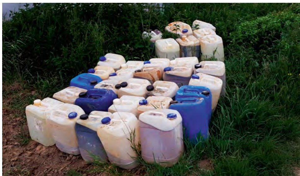
^ Илл. 7. Нелегальный выброс химических отходов в природном заповеднике как побочный результат производства синтетических наркотиков (NOS, 2018) / Fig. 7: Illegal chemical waste dump in a nature reserve as the by-product of synthetic drugs production (NOS, 2018)

While most of eastern Europe is expected to lose a substantial part of its population, the population of Western Europe will grow in the decades leading up to 2050. Most of that increase is due to immigration and the pull of large conurbations. The larger Dutch cities attract young higher educated professionals with their universities, higher education and concentrations of employment. Cities like Amsterdam, Rotterdam, The Hague and Utrecht continue to add (young) inhabitants while the more rural regions in the periphery of the country experience a modest population decline. That decline