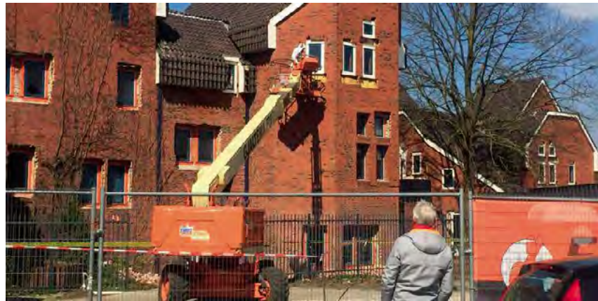
^ Илл. 9. Снос библиотеки Виншотена, построенной в 1975 году по проекту Кора Калфсбека, 2019 год (DVHN, 2019) / Fig. 9: Demolishment of the Winschoten library in 2019, designed by Cor Kalfsbeek in 1975 (DVHN, 2019)

Dutch policymakers pay sufficient attention to the generic challenges faced by small settlements and their built heritage. Effective networks that deal with research, education, practice and policymaking in this area exist. Societal changes related to the built environment produce unexpected side effects with profound but regional impacts. Four challenges are presented in this overview: induced earthquakes, the illegal production of synthetic drugs, mass tourism and the vulnerability of 1970s and 1980s community buildings as young heritage. These issues aren't easily addressed as one integral policy topic. Solutions need to be tailor-made and site-specific, and solving them has to start with the acknowledgement that small Dutch (historic) settlements face some serious big city problems.