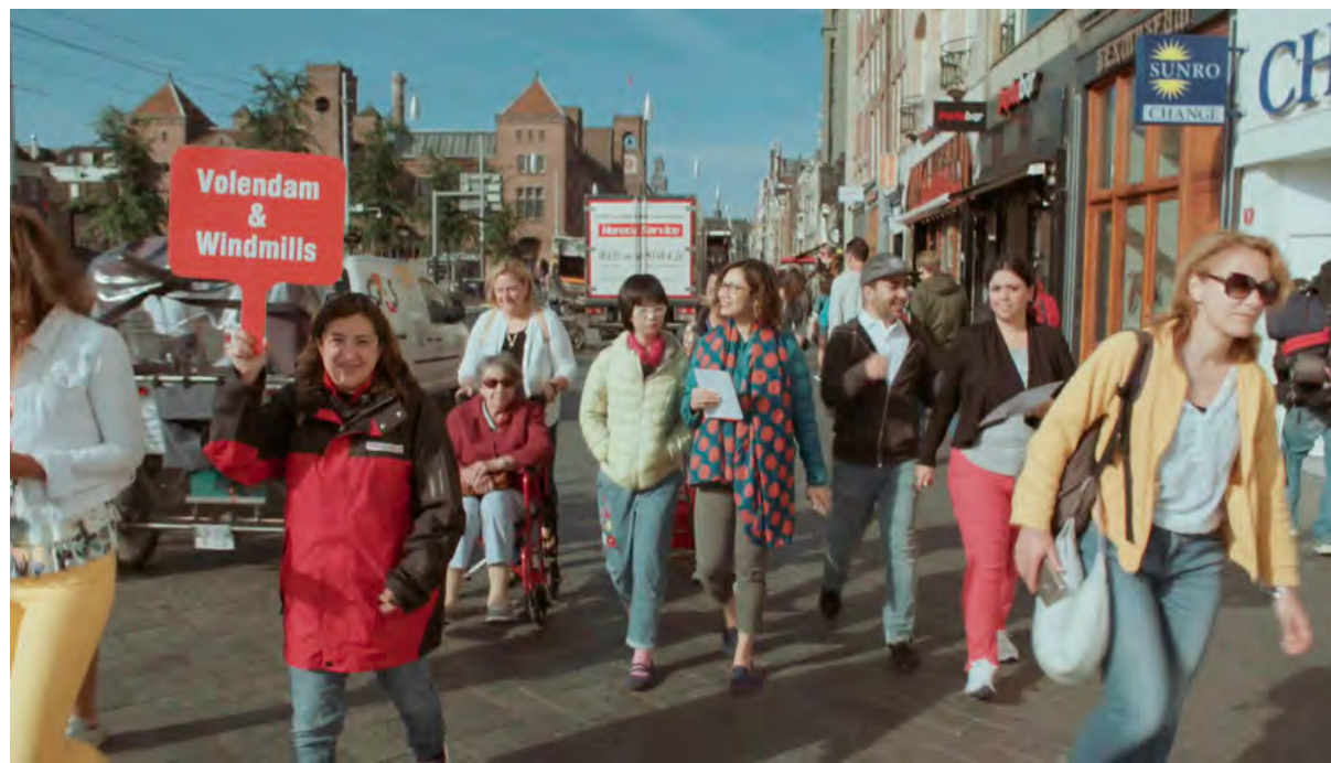
< Илл. 8. Туристам в Амстердаме предлагается посетить Волендам (Omroep NTR, 2017) / Fig. 8: Tourists in Amsterdam are attracted to visit Volendam (Omroep NTR, 2017)

иммиграцией и включением пригородов в черту городов. Большие голландские города привлекают молодых профессионалов наличием университетов, высшего образования и концентрацией рабочих мест. В Амстердаме, Роттердаме, Гааге и Утрехте продолжается рост молодого населения, в то время как в сельских регионах на периферии наблюдается умеренный спад. Этот спад идет в ногу с растущей индивидуализацией голландского общества: все больше людей живут в домах или квартирах на 1-2 человека; больших семей становится все меньше. Следовательно, в целом по стране ожидается рост числа домов даже в районах депопуляции. Пустующих домов будет немного, или их не будет совсем. С общественными зданиями ситуация оказалась более проблемной. Церкви, школы, библиотеки и медицинские учреждения утрачивают свои позиции. Автономная мобильность и услуги 5G