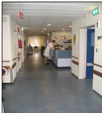
Ondersteuning langs wanden