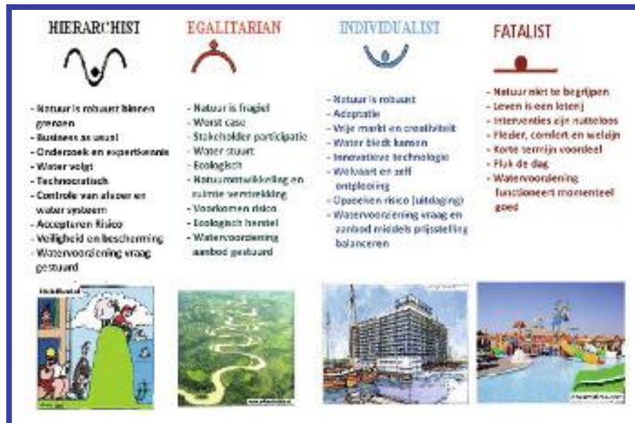
Afb. 1: De vier invullingen van de stereotiepe perspectieven op water en waterbeheer.

We onderscheiden drie niveaus: overtuigingen op wereldbeeldniveau (verwijzend naar fundamentele visies op water en de toekomst), op managementstijlniveau (wat willen we hoe bereiken) en op managementstijlprocesniveau (verantwoordelijkheden en besluitvorming). Omdat perspectieven in de praktijk niet stereotype zijn maar veelal bestaan uit interpretaties vanuit verschillende stereotype perspectieven, mochten respondenten per vraag nul tot en met vier antwoordopties aanvinken. Elke antwoordoptie (of combinatie) kreeg een code toegekend (variërend van 0-13), zodat achteraf geanalyseerd kon worden hoe vaak een antwoordoptie (perspectief) was gekozen. De vragenlijst is ingevuld door 152 respondenten vanuit verschillende professionele achtergronden (waterschappen, kennisinstituten, Rijkswaterstaat, ministeries, ngo's en overheden) met een gemiddelde leeftijd van 44 jaar. 76 Procent was man, 24 procent vrouw en respondenten waren gelijkmatig gespreid over Nederland (op