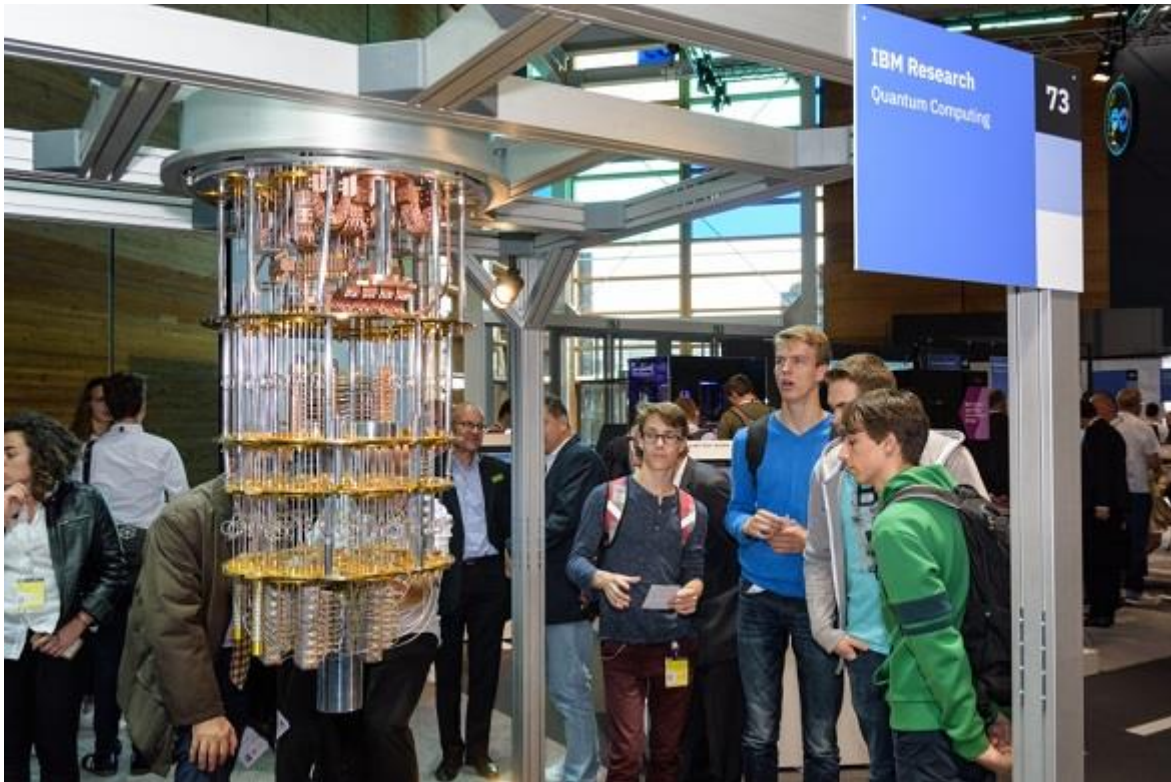
IBM toont een model van kwantumcomputer in hun paviljoen op Cebit 2018 in Hannover

De economische en nationale veiligheidsbelangen van Nederland worden beide gediend door snel toegang tot de eerste generaties van grotere operationele quantumcomputers. Het leveren van een sleutelbijdrage aan een Europees project voor het bouwen van deze quantumcomputers lijkt daarvoor het beste middel.