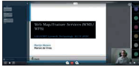
Impressie van online onderwijsplatforms

tentamen, essay- of werkopdrachten in plaats van reguliere schriftelijke tentamens). Voor alle betrokkenen is de impact groot en vooral voor buitenlandse studenten (twee derde van de Geomatics-studenten) is het een zware tijd. Door extra aandacht van de staf richting de studenten wordt getracht de studie zo goed mogelijk voort te zetten. Enige studievertraging is niet uit te