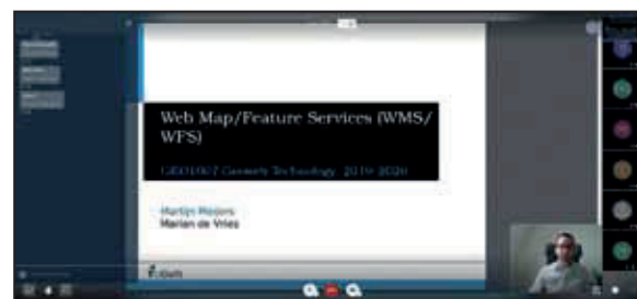
Impressie van online onderwijsplatforms

Sinds halverwege het derde kwartaal wordt het onderwijs bij de TU Delft (en elders) geheel online verzorgd. Dit heeft grote gevolgen voor de studenten en de staf van zowel de MSc GIMA als de MSc Geomatics. Hoewel de MSc GIMA als een mix van contact- en afstandsonderwijs is ingericht, zijn juist de contactweken altijd erg belangrijk. In deze twee weken vinden de afronding van eerdere modules plaats (tentamen, presentaties), de start van nieuwe modules (colleges, practicums), de midterm presentaties en afstudeerpresentaties en ook de diploma-uitreikingen. Helaas moesten de van 23 maart tot 3 april geplande contactweken in Wageningen online plaatsvinden. Dankzij inzet van docenten en studenten zijn alle onderwijsonderdelen uitgevoerd, al blijft het vreemd om een afstudeerpresentatie te geven vanaf je zolderkamer. Inmiddels lopen nu de reguliere 11 weken