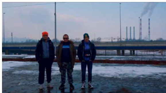
< ^ Рис. 6. Кадры из видео BOMBE DEVEDESETIH «Daga Daga» / Image 6. Stills from the BOMBE DEVEDESETIH – Daga Daga video