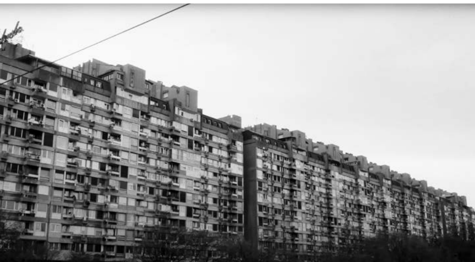
^ v Рис. 5а, б, с, д, е, ф, г. Кадры из видео SURREAL «Seks, Zdravlje i Pravoslavlje» (Новый Белград глазами художника и фотографа Boogie) / Image 5a, b, c, d, e, f, g. Stills from the SURREAL – Seks, Zdravlje i Pravoslavlje video (Novi Beograd as seen through the lens of visual artist and photographer Boogie)