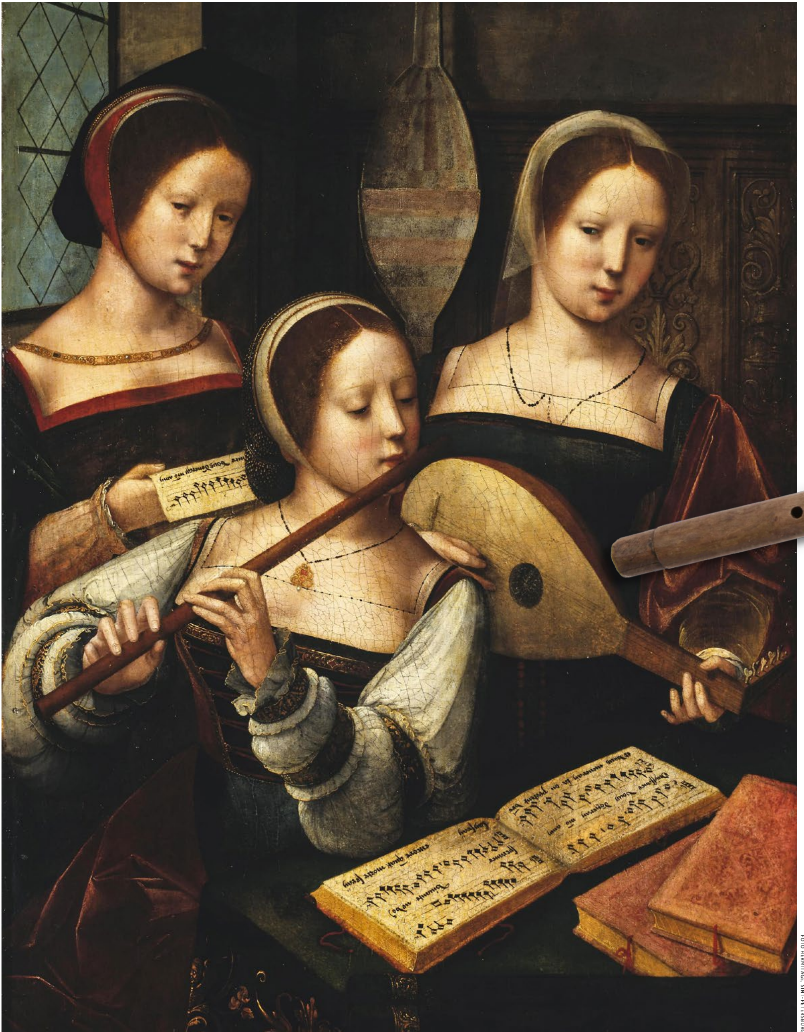
Geschilderd in de jaren 1530: fluitspel in huiselijke kring, samen met luit en zang