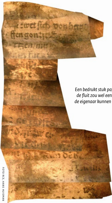
Een bedrukt stuk papier in de fluit zou wel eens naar de eigenaar kunnen leiden