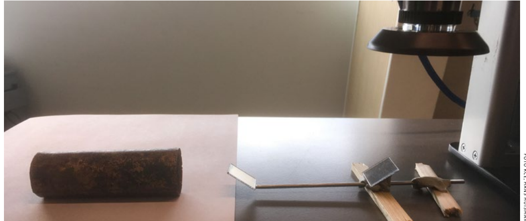
Het papier in de buis is met een geïmproviseerde periscoop gefotografeerd

Wat tot nog toe niet bekend was bij renaissance-fluiten zijn lange buisstukken van messing, zoals het instrument uit het Markermeer die heeft. Bij andere exemplaren ontbreekt metaal volledig. Op schilderijen uit de zestiende eeuw staan alleen fluiten die helemaal van hout zijn, of die smalle metalen ringen aan de uiteinden hebben. De enige afbeeldingen van vergelijkbare buizen bevinden zich in twee boeken. In het eerste gedrukte boek over muziekinstrumenten, Musica getuscht van Sebastian Virdung uit 1511, staat een houtsnede van een tenorfluit met een dubbele lijn bij het mondgat. Die is eerder aangezien voor versiering, maar het zou de rand van een metalen buis kunnen voorstellen. En in Martin Agricola's Musica instrumentalis deudsch uit 1529 zijn vijf fluiten met dubbele lijnen afgebeeld. Wel ontbreekt op deze prenten de kortere buis die de fluit van Warder