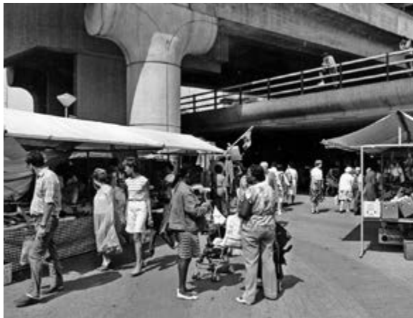
v Рис. 18. Весь ансамбль Омморда остается нетронутым на своих 120 гектарах / The complete ensemble of Ommoord is still out there with its full 120 hectares