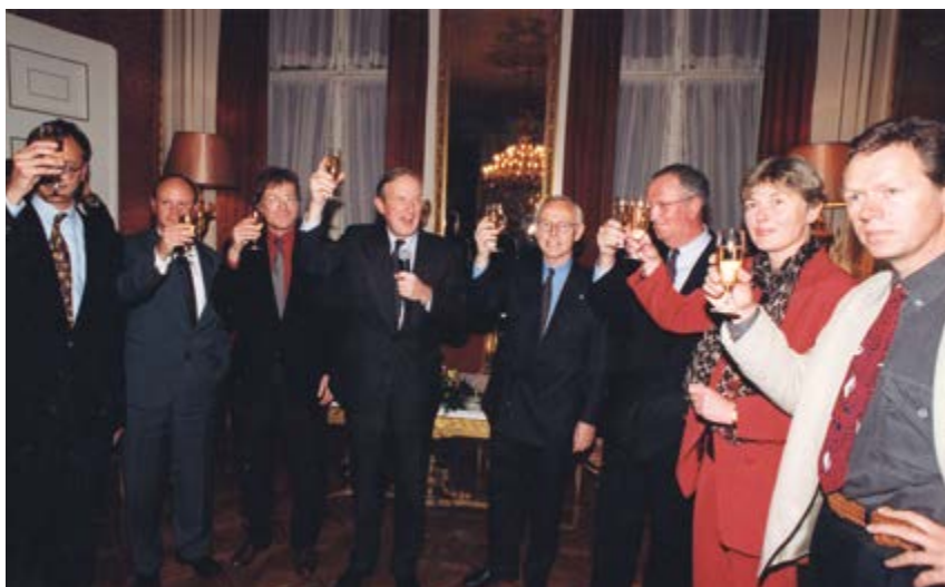
^ Рис. 6. Официальная встреча в резиденции мэра, на которой был поднят тост за решение снести часть Байлмермеера. Источник: Музей Байлмера / An official meeting took place in the mayor's residence, where a toast was given to the decision to demolish part of the Bijlmermeer (source: BijlmerMuseum).

of the original urban concept who strongly opposed the demolition of the Bijlmer. These so-called "Bijlmer-believers" emphasise that the original urban design was good enough, but that external factors lead to its downfall. They often refer to the budget-cuts during planning and construction. Planned public services, for instance, became the victim of austerity measures. They typically point fingers at the mass immigration from Suriname. Many Suriname citizens decided to move to Holland in advance of the country's independence in 1975. They entered the Bijlmermeer flats in large numbers by squatting vacant homes, which had a reverse impact on white citizens.