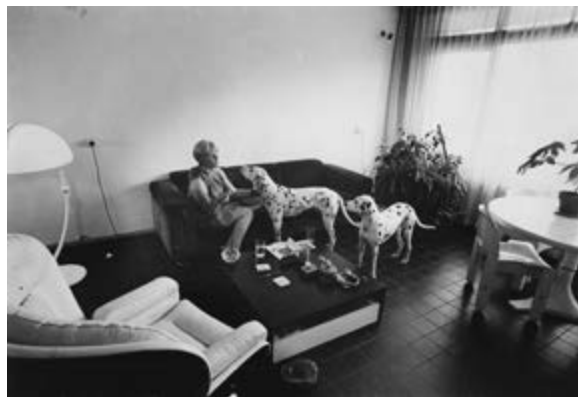
< Рис. 5. Интерьер гостиной в Байлмермеере. / Interior of a living room in the Bijlmermeer

When a city decides to destroy thousands of perfectly fine homes, things do become political and polarised. There are staunch defenders