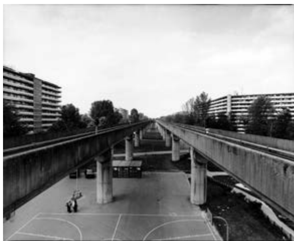
v Рис. 14. Внутренняя улица в жилом доме Grunder в Байлмере, часть E. Interior street in apartment building Grunder in the Bijlmermeer, part E