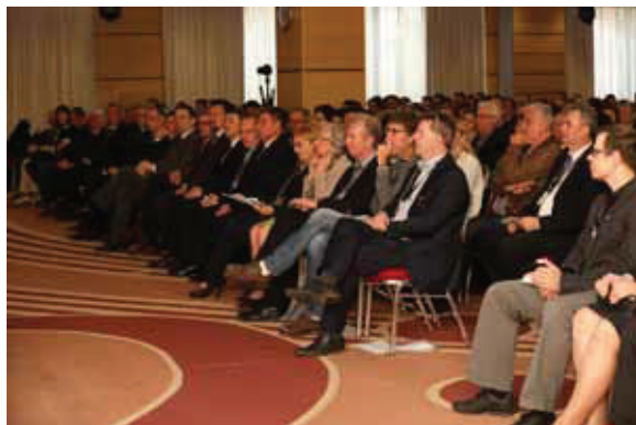
Het publiek luistert aandachtig toe.

In steeds meer landen is er aandacht voor de ontwikkeling en implementatie van LADM-standaard ISO 19152. Aan een tweede editie – inclusief de waardebepalingsfunctionaliteit – wordt gewerkt. Uitgebreidere ondersteuning van 3D en 4D Kadaster is noodzakelijk. Om de implementaties beter te ondersteunen worden ook technische modellen en coderingen voorgesteld (BIM/IFC, INTERLIS, RDF, InfraGML, CityGML). Om de transacties te bevorderen wordt zowel de mogelijkheid van een ‘blockchain’ als de opname van beeldverwerkingsprocessen overwogen. App-gebaseerde oplossingen zijn een andere relevante ontwikkeling. Van groot belang is het opnemen van LADM-implementaties in de praktijk. Dit zal door de Domain Working Group van het Open Geospatial Consortium worden georganiseerd. Om te komen tot de tweede editie wordt voorgesteld dat de FIG een ‘New Work Item Proposal’ (NWIP) bij de ISO Technical Committee 211 on Geographical Information indient, waarvoor ook de belanghebbenden en betrokken organisaties benaderd zullen worden.