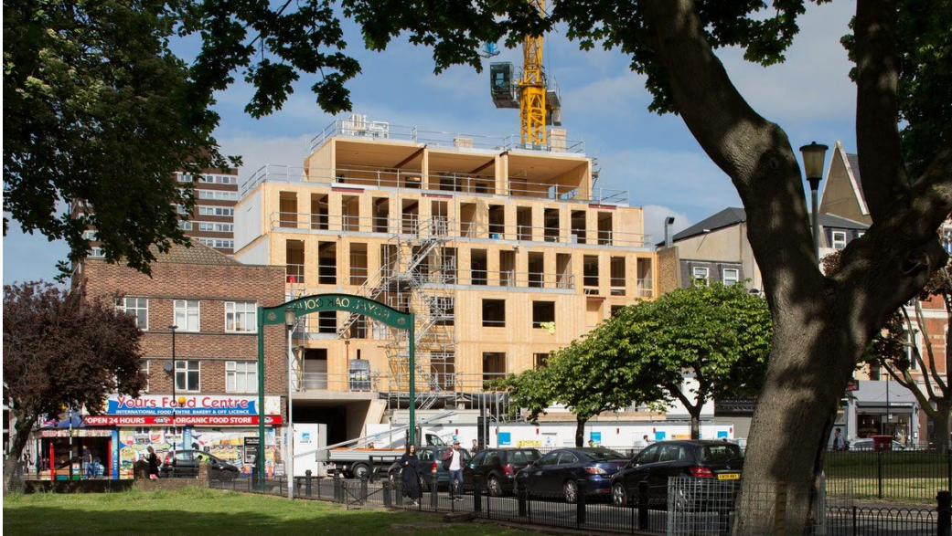
Figuur 2. Pitfield Street, Hackney Londen. De architecten Waugh Thistleton combineren CLT-techniek met renovatie van een bioscoop en uitbreiding met woningen. Verdichten en renovatie in een stedelijke omgeving met CLT-houtbouwtechniek biedt veel mogelijkheden voor steden.

Wat moet de rol van de rijksbouwmeester zijn?