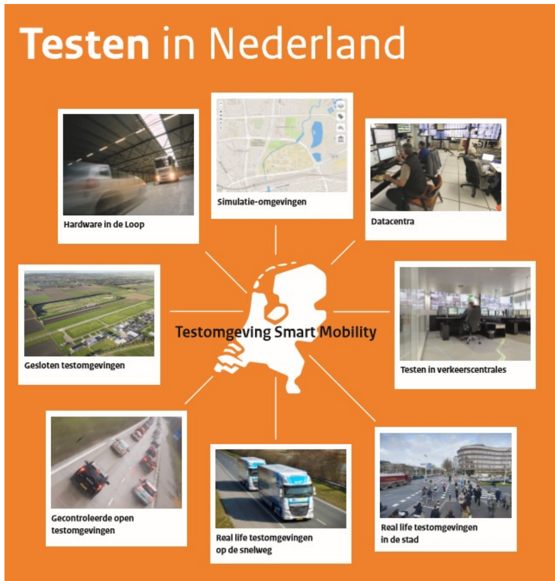
Figuur 1: Testomgeving Smart Mobility gepresenteerd (Van den Broek en De Bruijn, 2017).

De potentiële effecten van Smart Mobility toepassingen in Nederland worden momenteel veelal bepaald door middel van expert judgment. Daarnaast worden er veel pilots en praktijkproeven uitgevoerd en geëvalueerd. Op de Automotive Week 2017 heeft Nederland zich gepresenteerd als implementatieland voor slimme mobiliteit en de samenwerking tussen Nederlandse testfaciliteiten waar SimSmartMobility er één van is (Van den Broek en De Bruijn, 2017).