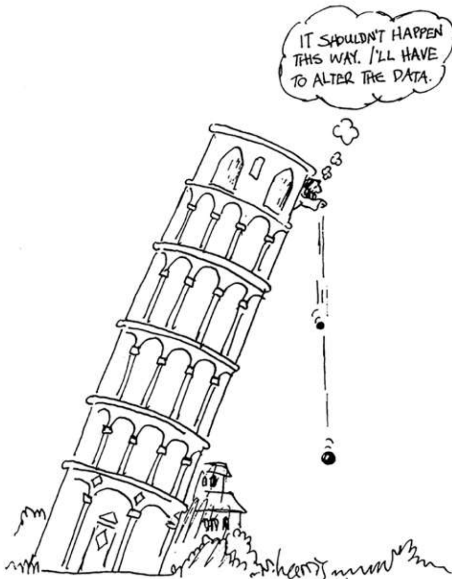
Figuur 2. De in 1994 gebruikte cartoon is nog steeds relevant: Leerlingen zijn wel eens bereid resultaten te veranderen zodat deze passen bij hun verwachtingen. Cartoon: Sidney Harris

te begrijpen. De te ontwikkelen nieuwe begrippen en/of verbanden geven daar dan uitdrukking aan. Daarbij moeten de onderzoeksmethoden en dataverwerking dus niet in de weg zitten, die moeten zo helder en eenduidig mogelijk zijn.