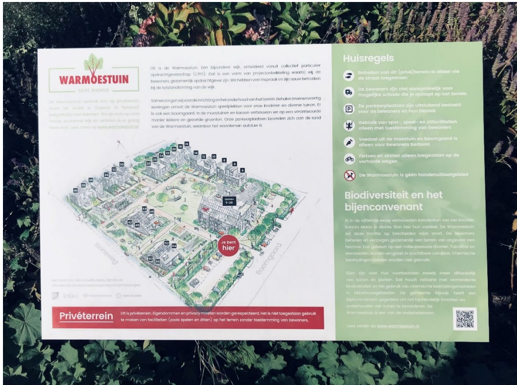
Figuur 2. Warmoestuin Rijswijk is een wooncoöperatie waar gelijkgestemden rond een moestuin wonen. Het initiatief lag bij de architect INBO. Bewoners tekenden in en werden betrokken bij het ontwerp.

Wat is het verschil tussen collaborative housing en cohousing? Hoe ver gaat dat verschil? Is er een definitie? Bijvoorbeeld. Is het een woongebouw met individuele appartementen dat een dakterras, speeltuin of werkplek deelt zoals het Familiehuis in Delft of is het een woongemeenschap op ideologische basis waar alles gedeeld wordt?