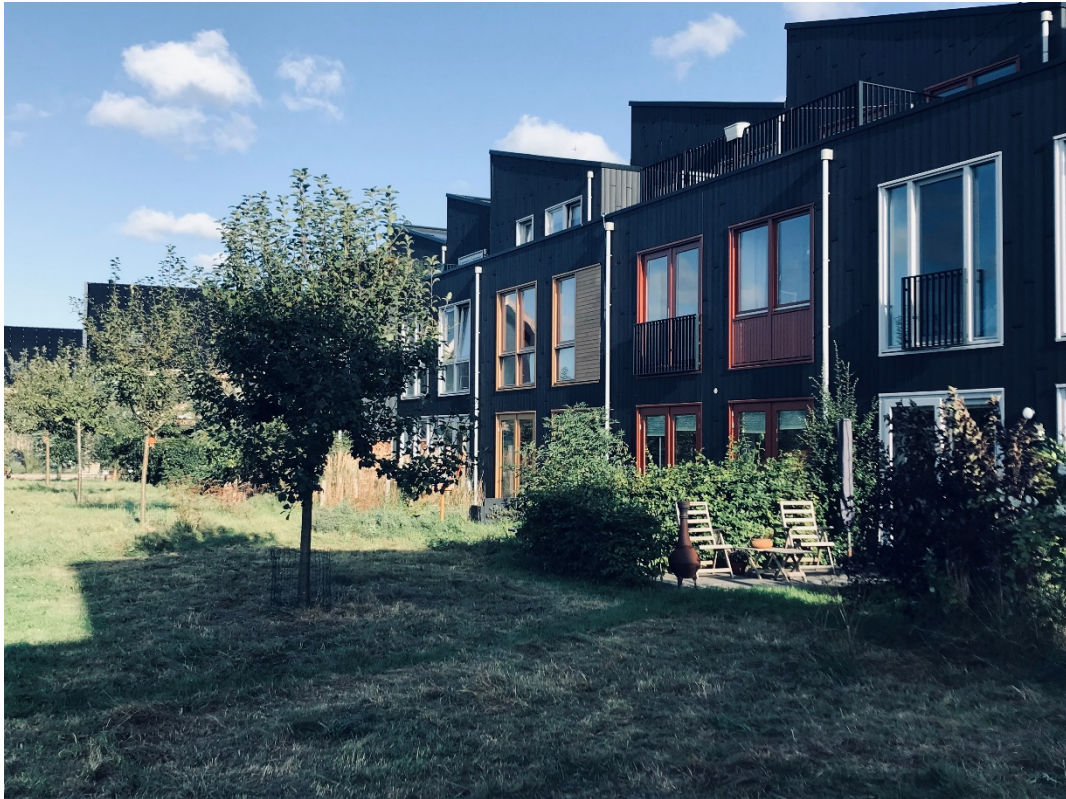
Figure 5. Warmoestuin Rijswijk, de gemeenschappelijke boomgaard en keukentuin waar de bewoners mogen oogsten.