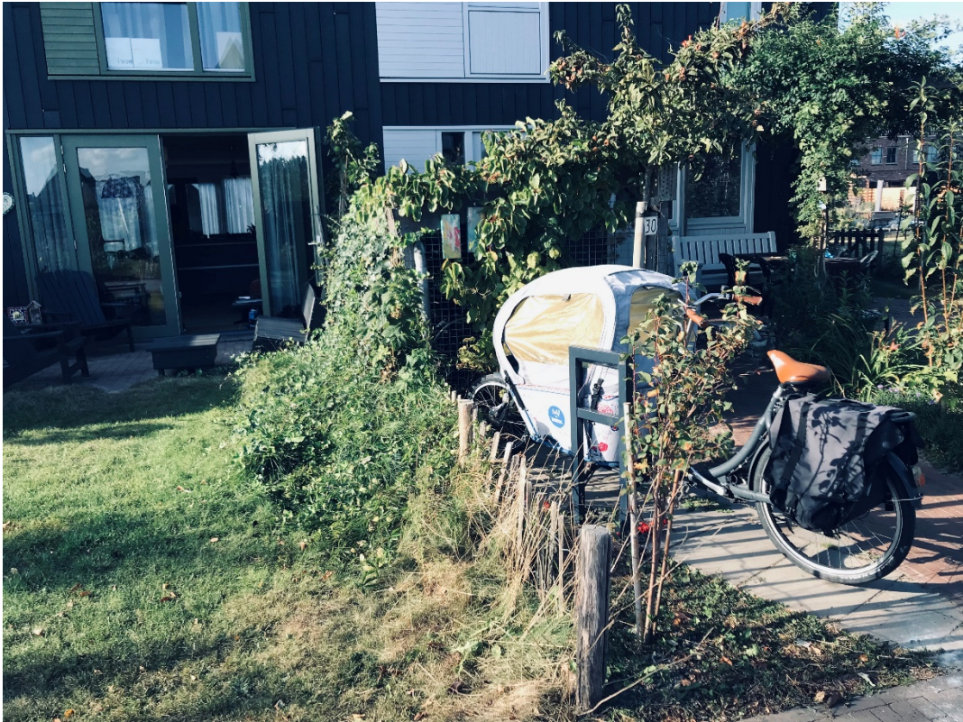
Figuur 6. Warmoestuin Rijswijk.