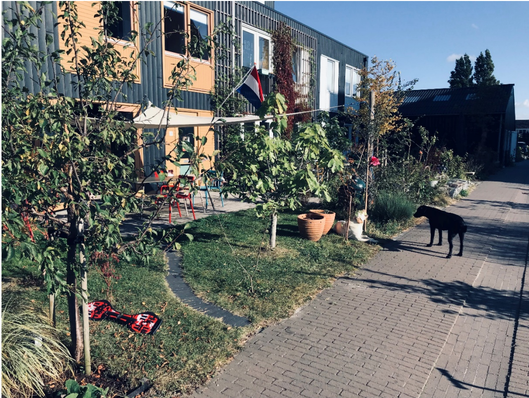
Figuur 4. Warmoestuin Rijswijk, de privé tuin is de transitiezone tussen de huizen en de gemeenschappelijke tuin.

In hoeverre wordt er in cohousing gedeeld? Moeten ideeën of religie of etnische achtergrond worden gedeeld? Moeten er extra voorzieningen worden gedeeld, zoals auto, scooters, werkruimte, woonkeuken, tuin, extra kamer met douche?