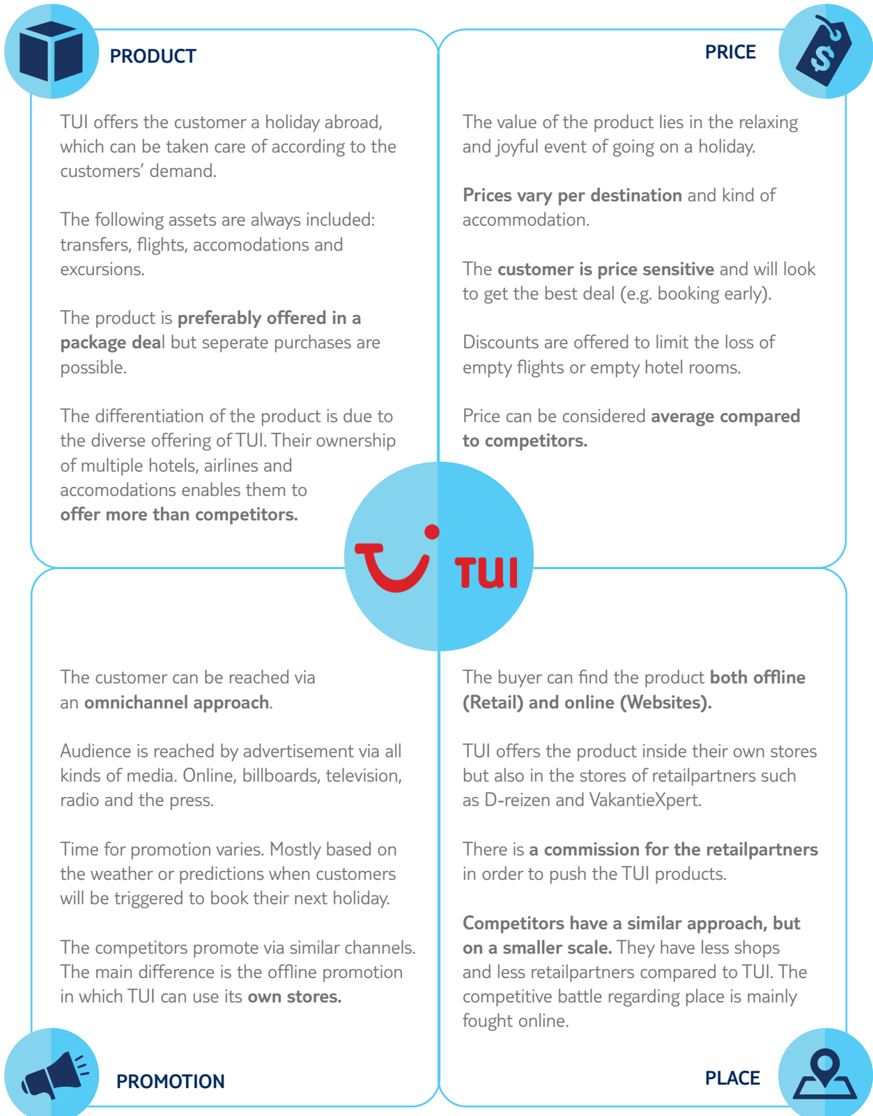
Figure 1: Marketing Mix

For this project, it is important to analyze what TUI is offering. The company can lure the customer to their product from different channels. The product is preferably offered in a package deal, in which pricing is very important as the customer is relatively price sensitive and can switch easily to an alternative company. We can conclude that the company should continue to exploit their omni channel approach in order to differentiate.