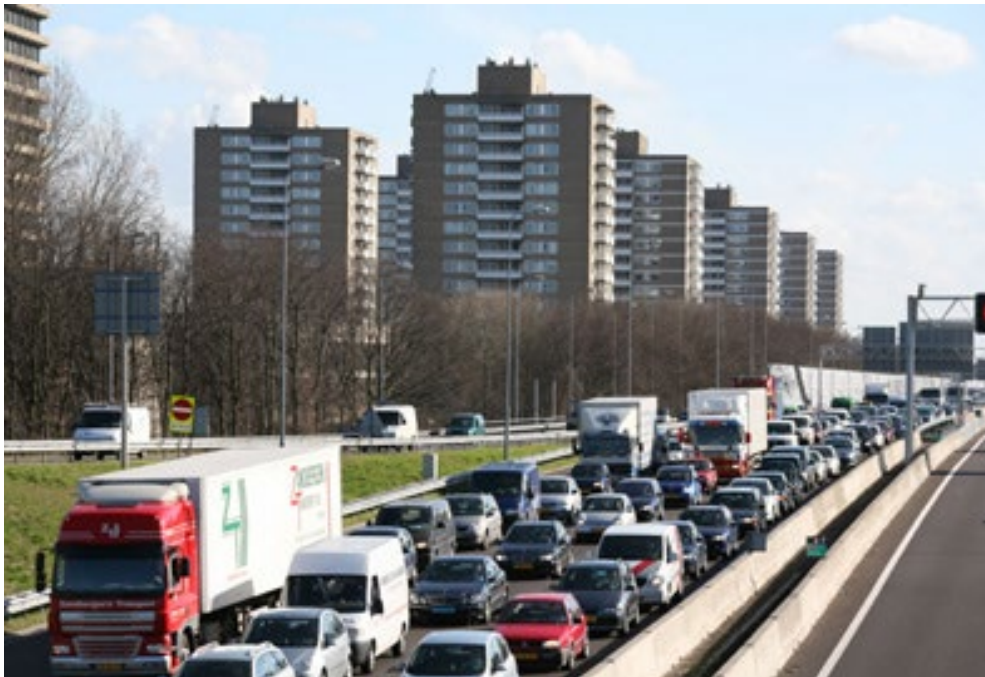
Figuur 6. Amsterdam-Noord.

Deze ontwikkeling heeft wel een belangrijk maatschappelijk aandachtspunt; de groeiende scheiding tussen de mensen die in 'autoland' wonen en mensen die in 'fietsland' wonen en werken. De steden spelen een belangrijke rol in de verbinding van alle groepen in onze samenleving en moeten dus ook toegankelijk blijven voor alle groepen. Het is dus de grote uitdaging om de wereld van de actieve en collectieve mobiliteit te verbinden met de wereld van de individuele mobiliteit zoals auto's en scooters.