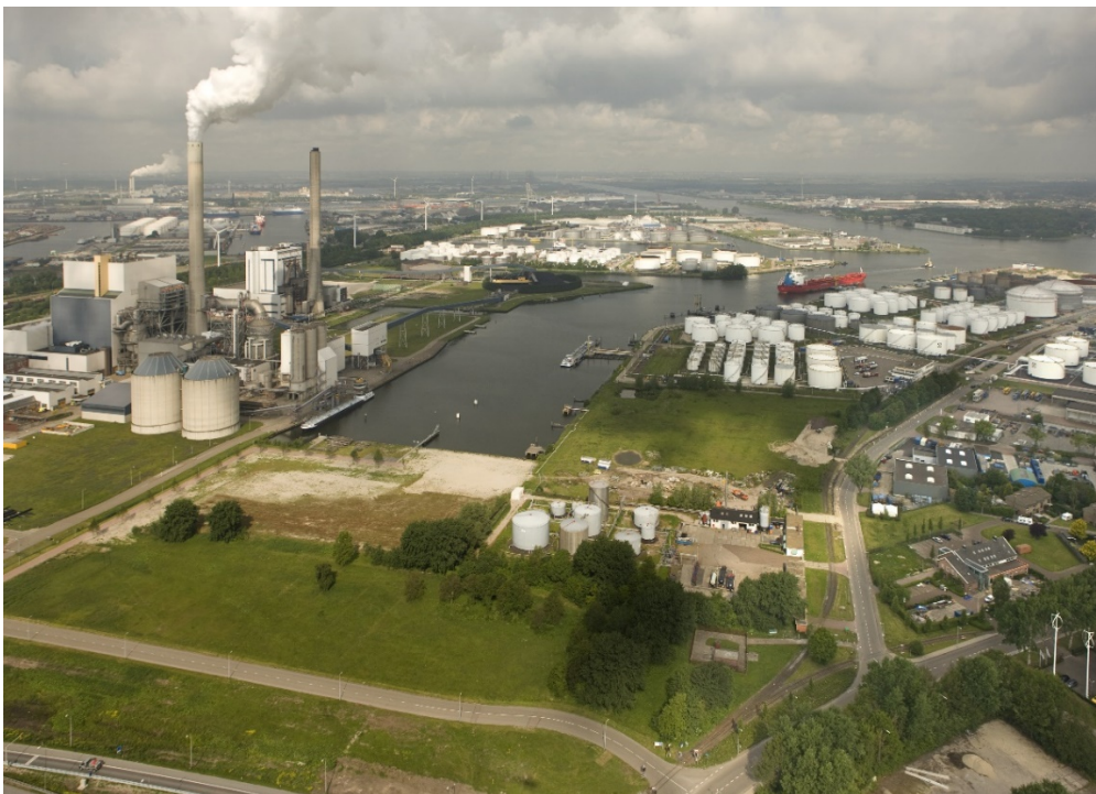
Figuur 3. Mercurius haven in Amsterdam in 2009 met op de achtergrond de Hemwegkolencentrale die binnenkort gaat sluiten.

veel te makkelijk een inbreidingslocatie op bedrijventerreinen. Maar ook arbeidsplaatsen moeten evenredig meegroeien met de groei van de stad. Het wordt dus hoog tijd dat er een binnenstedelijk pact wordt gesloten waarin de woningbouwopgave vooral landt in bestaande wijken en bedrijven de verplichting krijgen om de beschikbare ruimte veel efficiënter en intensiever gebruiken. Een mooi voorbeeld vind ik de discussie over de toekomst van bedrijventerrein Lage Weide in Utrecht. Gezien de ligging op de multimodale corridor naar Amsterdam is het een ideale binnenstedelijke woningbouwlocatie. Maar juist vanwege de transitie naar een circulaire economie is ervoor gekozen om Lage Weide als het grootste regionale bedrijventerrein te behouden en te intensiveren. Zo behoudt de stad ook veel ruimte voor praktisch geschoolde werkgelegenheid op fietsafstand van wijken waar nu en in de toekomst veel arbeidspotentieel woont.'