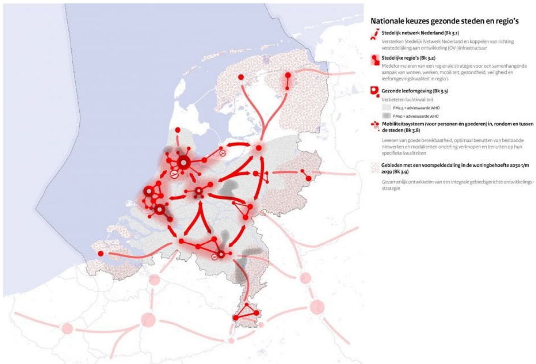
Figuur 5. De stedelijke regio's zijn gekoppeld aan het netwerk van bestaand (OV)infrastructuur en vormen samen het Stedelijk Netwerk Nederland. De gearceerde hebben een voorspelde daling in de woningbehoefte. Bron: Nationale Omgevingsvisie. Duurzaam perspectief voor onze leefomgeving. Ministerie van Binnenlandse Zaken en Koninkrijksrelaties. September 2020.

'Amsterdam is de meest internationale stad van Nederland en staat dus niet model voor de algehele ondergang van steden in Nederland. En ook in Amsterdam zelf gaat het niet zo slecht als de krantenkoppen doen geloven. De stad heeft nu vooral last van het vertrek van de 'global citizens'. En dat zijn niet alleen expats, maar ook internationale studenten en avontuurlijke kenniswerkers. Maar die komen straks wel weer terug, als de Coronapandemie voorbij is. Daarnaast zijn het vooral gezinnen die de afgelopen jaren steeds vaker vertrekken, maar deze golfbeweging is van alle tijden en doet niets af aan de stad. De stad is als onderwijsmarkt, liefdesmarkt en carrièremarkt een belangrijke trekker voor jonge mensen. De stad trekt alleenstaanden aan en produceert gezinnen. Het is vooral belangrijk dat deze gezinnen een goede kans hebben om een passende en betaalbare woning te vinden. En daar ontbrak het de laatste jaren vooral aan, waardoor sommigen noodgedwongen de stad moesten verlaten. Dus ook hier geldt weer dat bij de verdichting van wijken vooral de kwalitatieve behoefte beter bediend wordt dan in het verleden is gebeurd.'