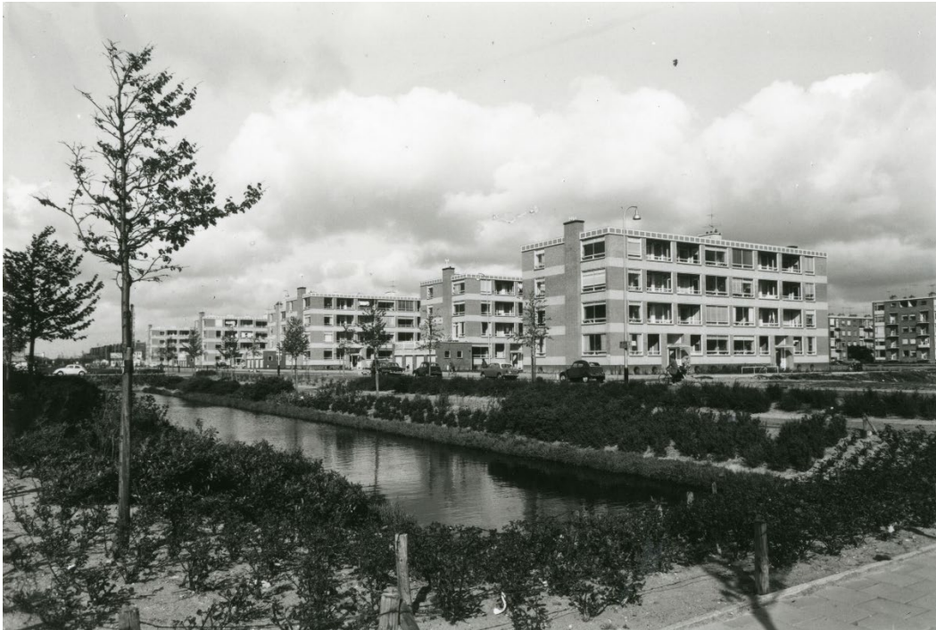
Figuur 2. Den Haag Zuidwest, Hengelolaan in 1962. Woongebouwen is het ruime groen.

toch de neiging om de onderkant op te zoeken. Ieder balkon dat ze niet hoeven te maken, wordt onmiddellijk geschrapt.'